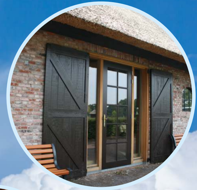
Verwerkt tot gevelement