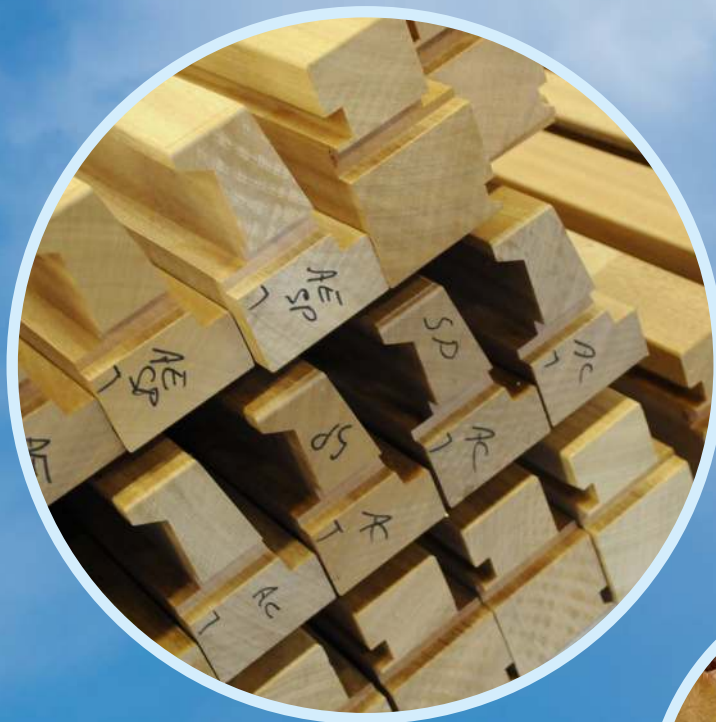
Kozijnonderdelen met FSC-keurmerk

Duurzaam produceren is mooi, maar het wordt nog veel mooier als ook de toepassing zelf duurzaam is, zoals een perfect sluitend raam met isolatieglas