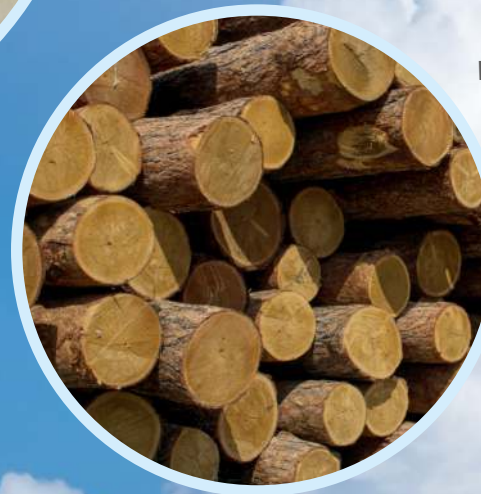
Hout als grondstof, duurzaam gekweekt